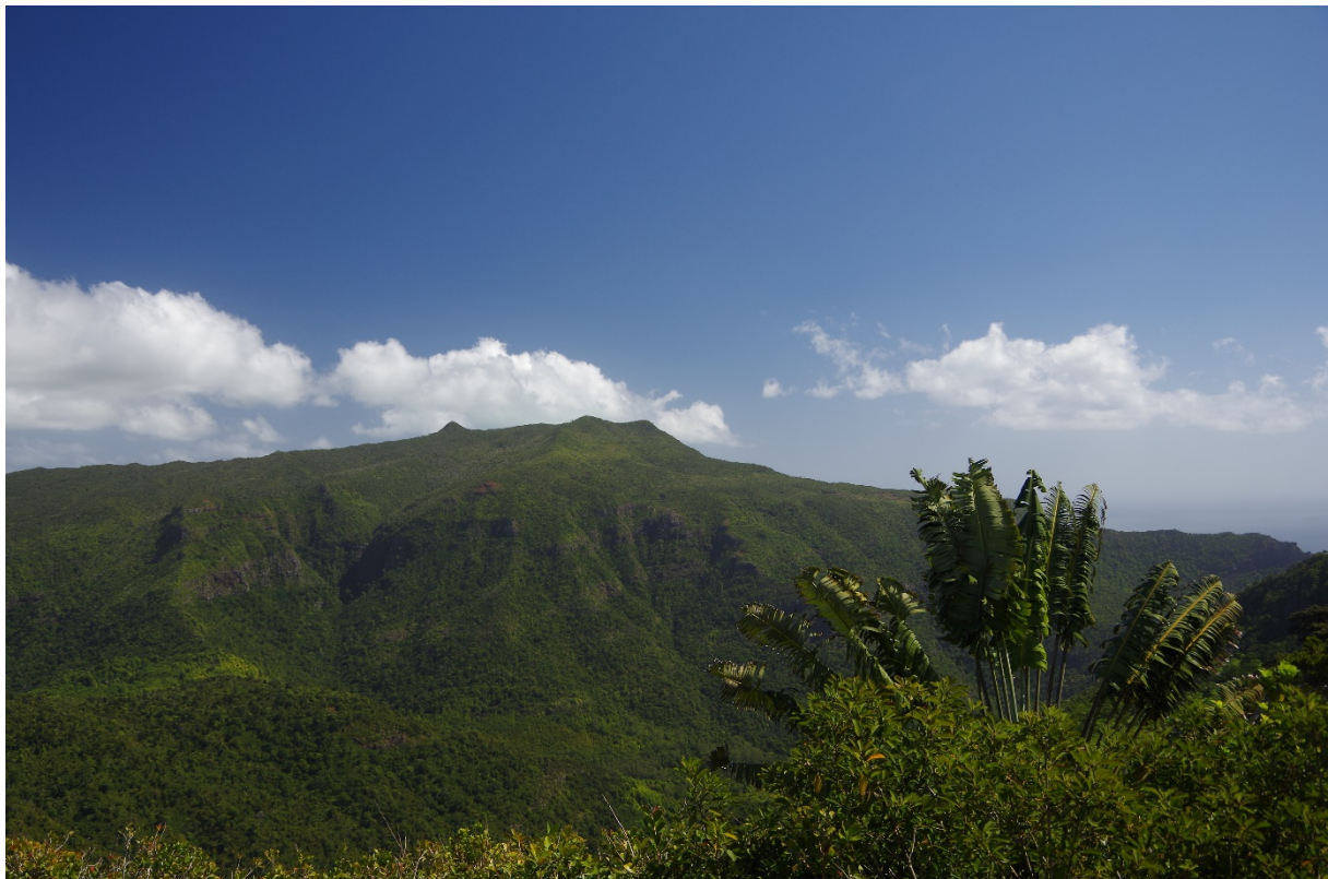
Black River Peak ist der höchste Berg von Mauritius

Start/Ziel: Le Petrin, Parkplatz (GPS: S20 24.494, E57 28.325)