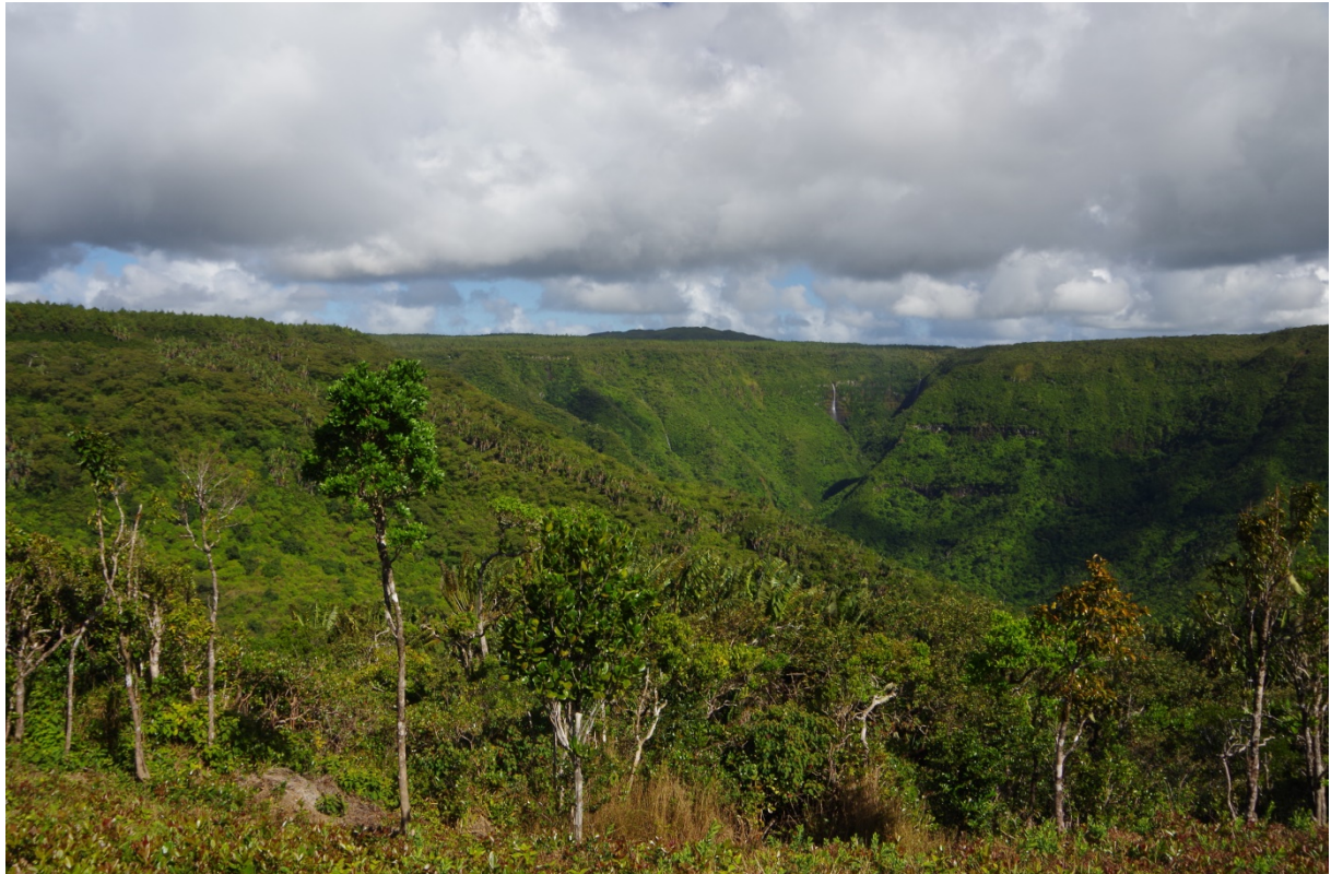
Blick in die Black River Schlucht

spektakulären Aussichten. An einer markanten Wegkreuzung biegt man nach links ab (GPS-Punkt S20 23.960, E57 27.474). Nun folgt man dem breiten Weg weitere zwei Kilometer. Immer wieder laden Aussichtspunkte zum Verweilen ein. Am GPS-Punkt S20 23.847, E57 26.799 zweigt der Maccabee-Forest-Trail nach links ab. Hier beginnt eine etwas schwierigere Phase, die leider bei nassem Wetter kaum begehbar ist. Empfehlenswert ist jedoch, zunächst dem GPS-Track bis zum Macchabee-Aussichtspunkt (S20 23.602, E57 26.418) zu folgen. Hier öffnet sich die Black River Schlucht in Richtung des Meeres, und man weiß nicht so recht, wo man vor Faszination zuerst hinschauen soll. Linker Hand erhebt sich der Black River Peak. Es ist der mit 828 Metern höchste Berg von Mauritius.