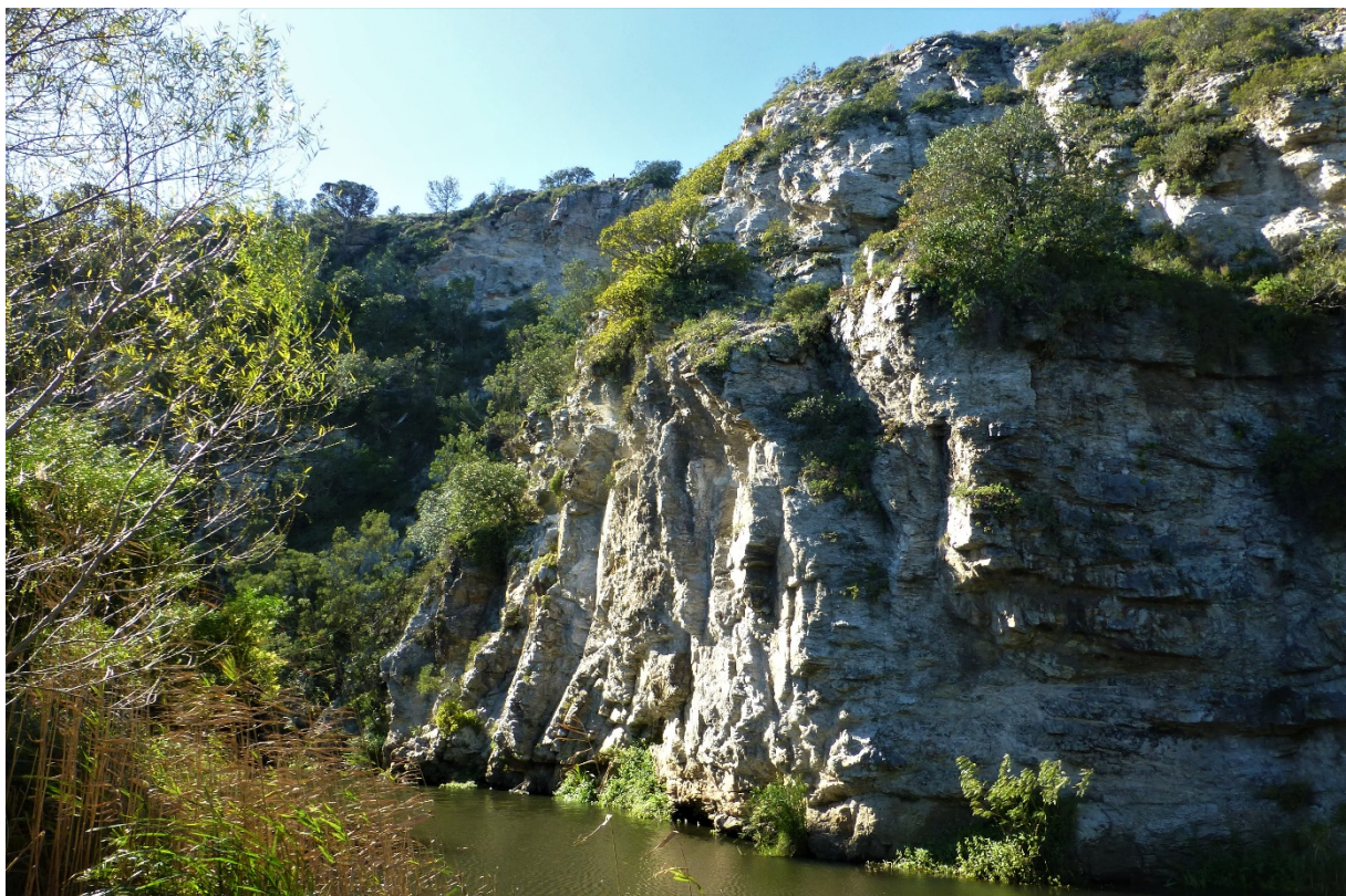
Malerisch schlängelt sich der Baakens River durch das Tal

Übernachtungsmöglichkeiten: Campingplatz, Hotels und B&B in Port Elisabeth