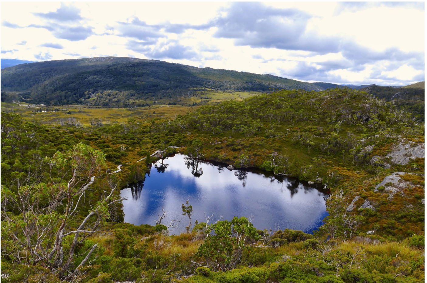
Blick von Marions Lookout auf den Wombat Pool

Übernachtungsmöglichkeiten: Weindorfers Chalets, GPS: S41° 38.317', E145° 56.616', hier lohnt es, den etwa einen Kilometer langen Weindorfers Forest Walk als Abendspaziergang zu gehen, weitere Übernachtungsmöglichkeiten und Camping am Visitor Center