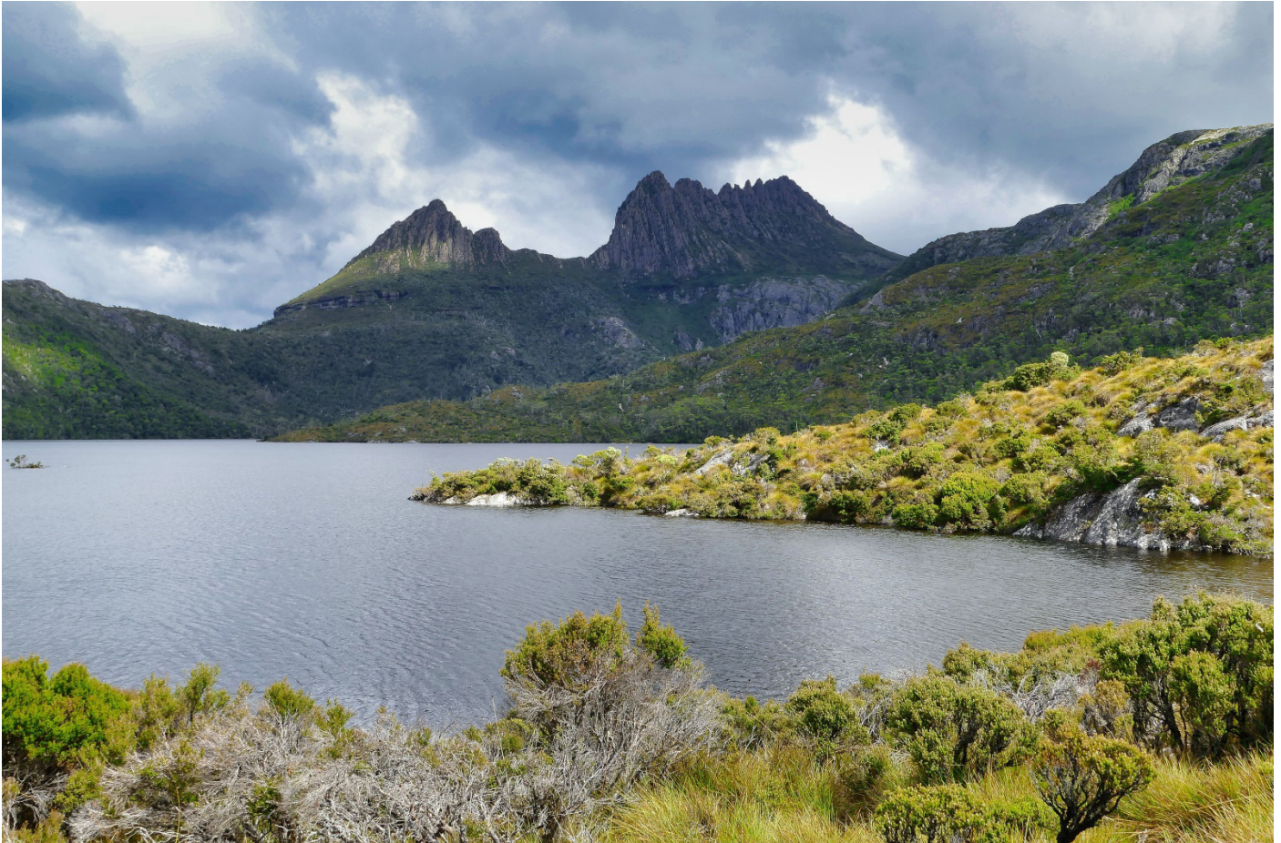
Blick über den Dove Lake

Übernachtungsmöglichkeiten: Peppers Cradle Mountain Lodge in der Nähe der Rangerstation, weitere Übernachtungsmöglichkeiten und Camping am Visitor Center